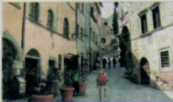
Artigianato ad Anghiari Continua la Mostra mercato